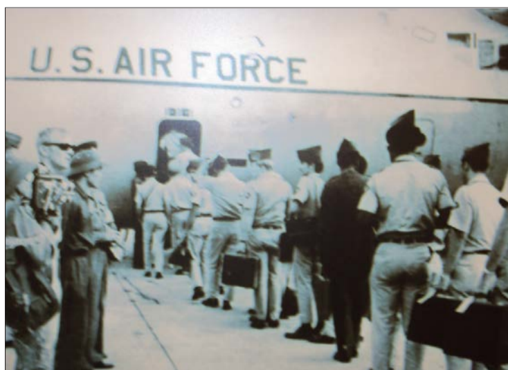
Отправка из Сайгона

Осенью 1967 г. интенсивность воздушных налетов авиации США на Ханой и другие населенные пункты на территории Северного Вьетнама заметно возросла. Ракетно-бомбовые удары американской авиации все чаще направлялись на объекты жизнеобеспечения столицы. Постоянным объектом ударов был расположенный в пару километрах по прямой от нашего посольства мост через Красную реку, построенный еще в колониальные времена по проекту легендарного архитектора Эйфеля. Многократно частично разрушенный, он всякий раз восстанавливался героическими усилиями вьетнамцев и устоял, оставаясь на всем протяжении войны главной жизненно важной стратегической артерией.