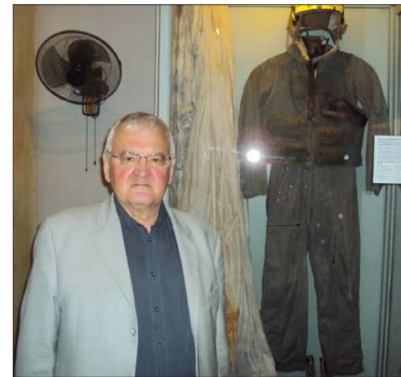
У витрины в тюрьме

...В один из массированных налетов 26 октября 1967 г. над Ханоем было сбито десять американских самолетов. Пилота одного из них, спустившегося на парашюте в озеро Чук Бать, удалось захватить живым. К месту приводнения американского самолета сбегалось и съехалось на велосипедах множество людей. Это был не первый случай