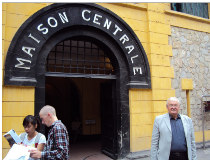
У входа в тюрьму

Нынешняя же деятельность Дж. Маккейна в должности Председателя сенатского комитета по вооруженным силам американского конгресса, его провокационные заявления, толкающие Президента США на конфронтацию с Россией, к развязыванию мировой ядерной катастрофы, наглядное подтверждение того, что полученный им лично урок, к сожалению, оказался невыученным.